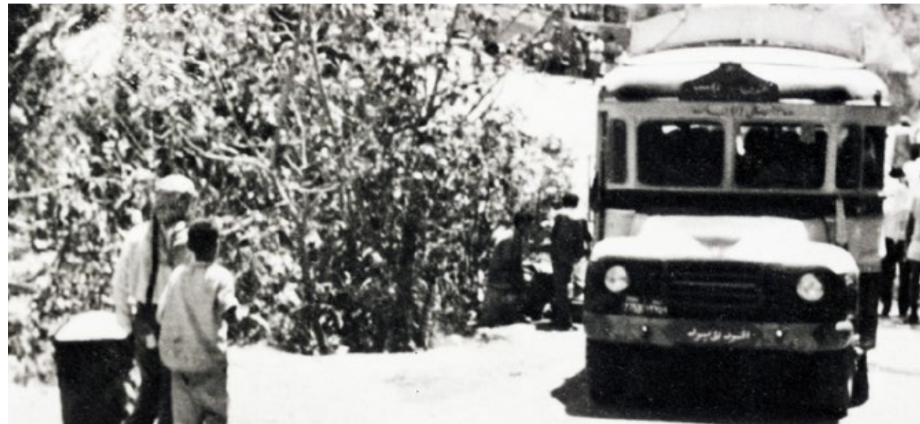
בכבוד רב, אחמד עפיפי יו"ר, קבוצת עפיפי